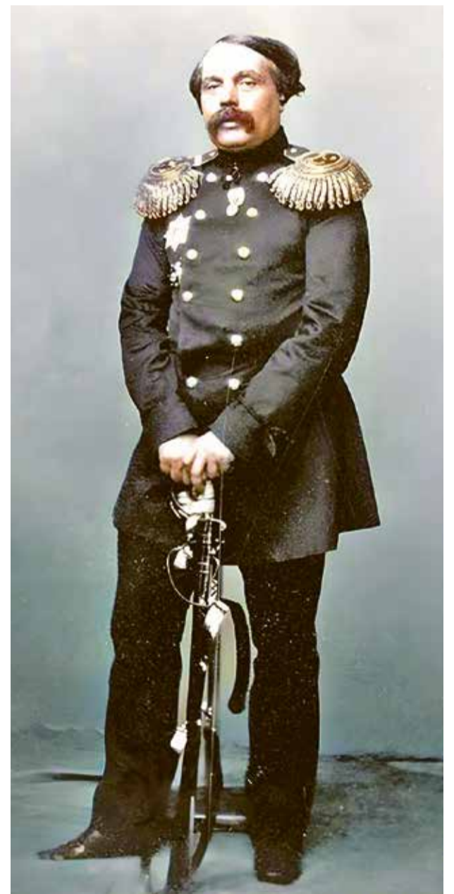
Петр Васильевич Казакевич (1814–1887 г.).

История сохранила имена наиболее состоятельных жителей поселка, на которых в 1927 году новой властью начались гонения, закончившиеся обязательным тогда раскулачиванием и образованием колхоза им. Дзержинского.