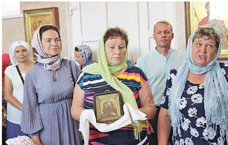
Информационный отдел Хабаровской епархии

Она была свидетельницей ратных подвигов наших казаков.